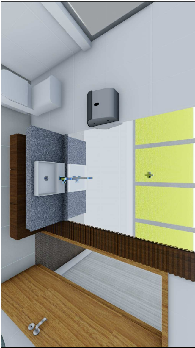
04 PERSPECTIVA SEM ESC.