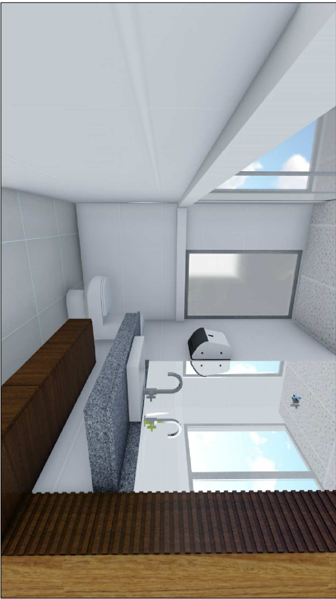
05 PERSPECTIVA SEM ESC.

PROPRIETÁRIO TRIBUNAL REGIONAL ELEITORAL – PR